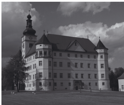
Lern- und Gedenkort Schloss Hartheim

Vermittlungsprogramm im Lern- und Gedenkort Schloss Hartheim